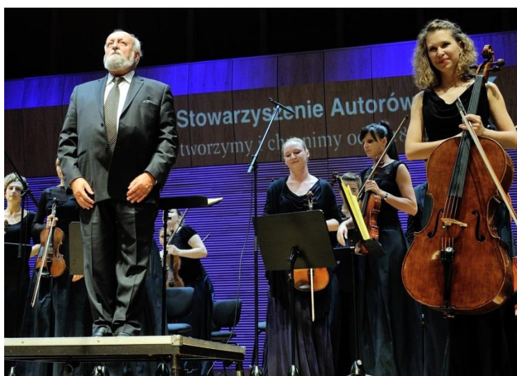
Krzysztof Penderecki podczas obchodów 95-lecia Stowarzyszenia Autorów ZAiKS, Łusławice, 2013