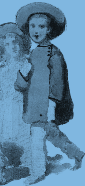
Teofil Kwiatkowski, Dwoje dzieci , akwarela | ok. 1840