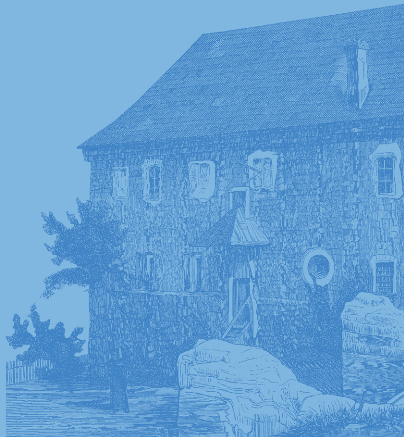
Wojciech Gerson, Dom Długosza w Sandomierzu | ok. 1880